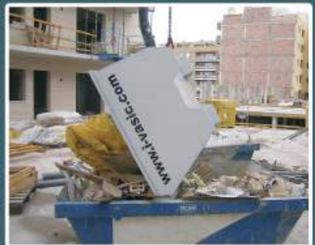
> Facilita la descarga, inclinación 70°