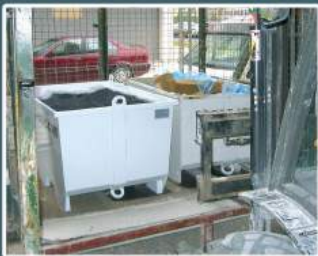
> Aprovecha el espacio, mejor acceso