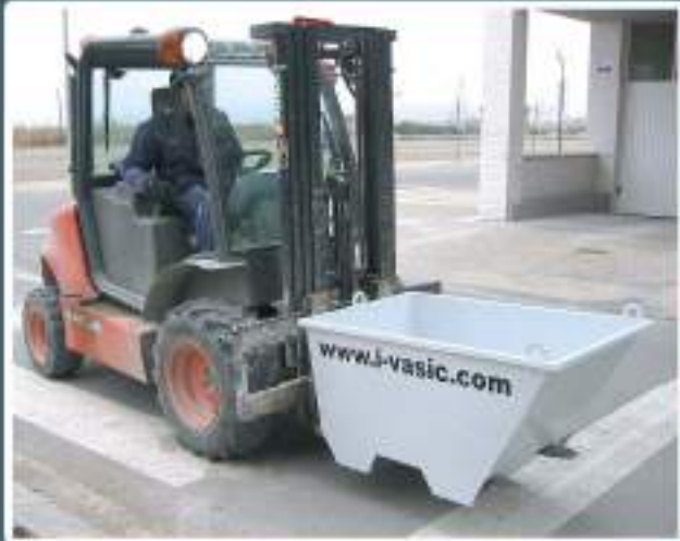
> Transporte en posición longitudinal, más compacto