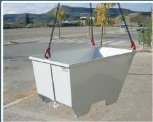
> 3 amarres para una mejor estabilidad y seguridad