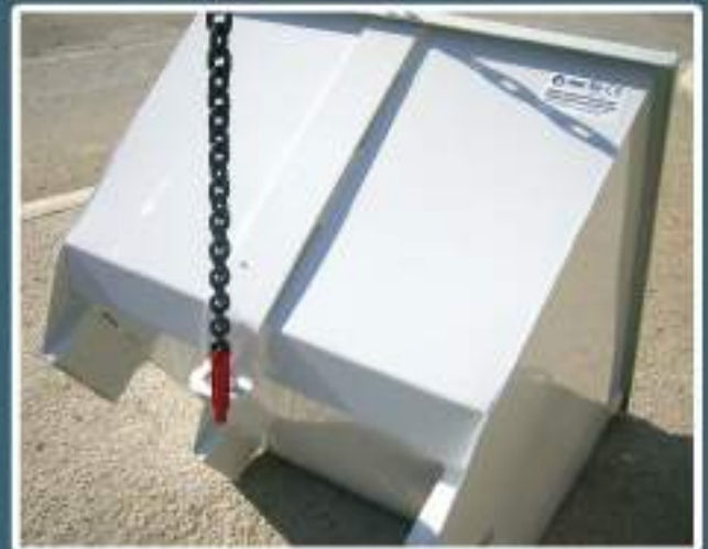
> Gran robustez, chapa 3 mm. Marcado CE