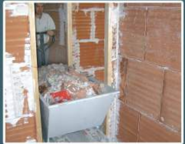
> Paso por puertas